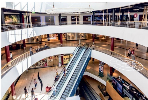
De forme ovale, il est réparti sur trois niveaux.