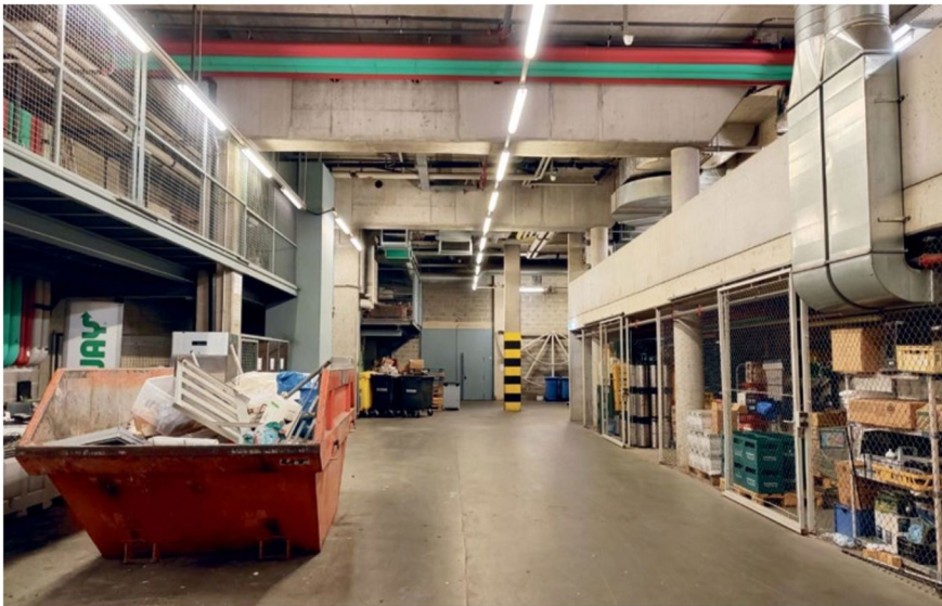
Une zone de recyclage a été mise à disposition dans les sous-sols.