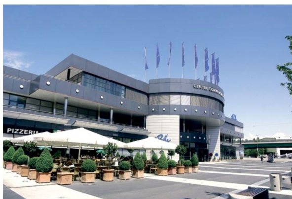
Le bâtiment a été construit en 2002.

Au cœur d'un quartier en pleine mutation, un bâtiment surdimensionné trône et attire les foules en son centre depuis plus de vingt ans: la Praille. immobilier.ch vous propose une plongée dans la gestion de ce site devenu un véritable temple de la consommation.